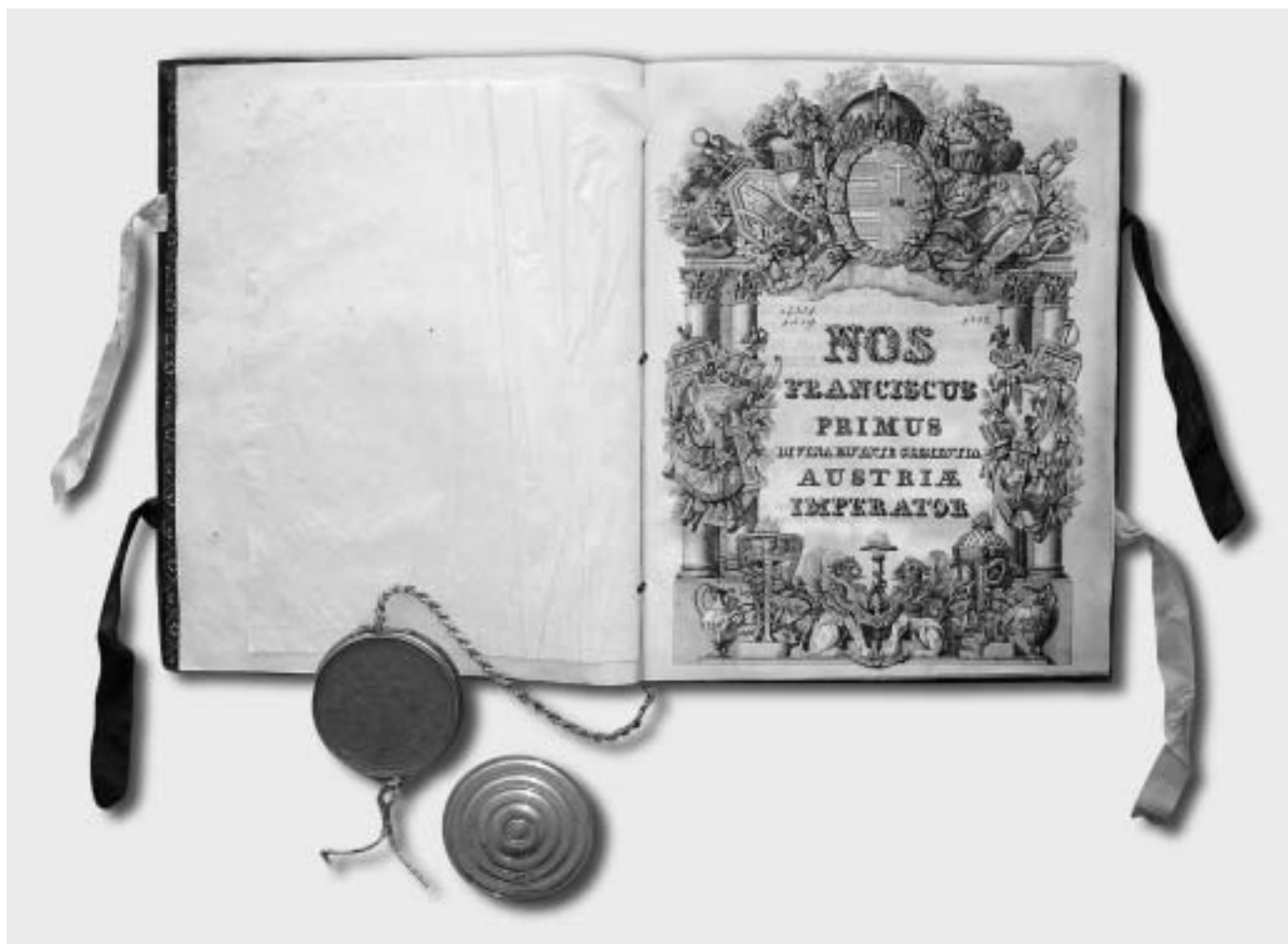
Jarmočné privilégia cisára Františka z roku 1832 (ŠA Zvolen)

rodín a hospodárstiev. Mestečko ešte v roku 1827 vydalo nariadenie, podľa ktorého krčmár nesmel dávať na dlh [90]. Okrem agendy notára si obyvatelia pri obchodovaní viedli aj vlastnú evidenciu. Napr. mletie múky v mlynoch sa tradične značilo na rováše [91].