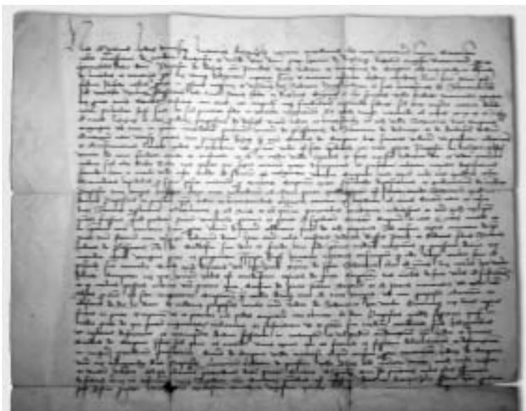
Listina mesta Zvolen z roku 1425. Svedectvá obyvateľov Pliešoviec (ŠA Zvolen)