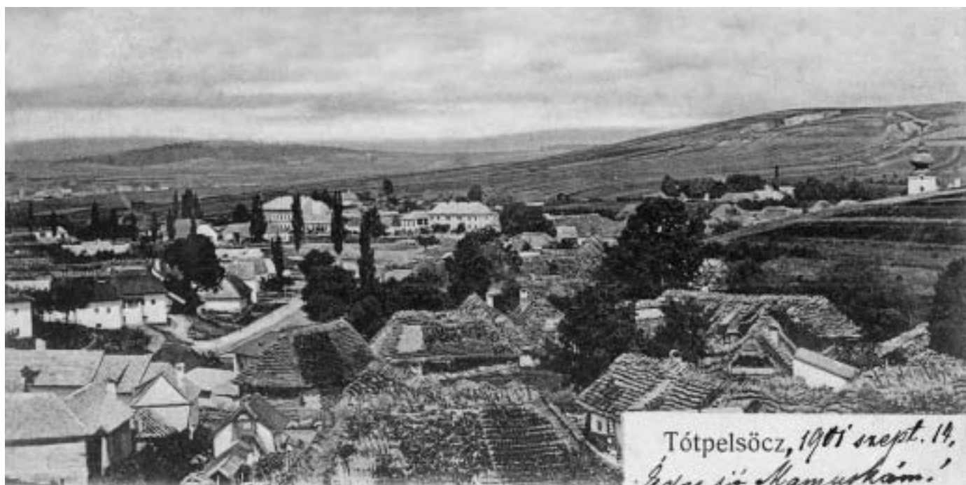
Pohľad na obec z juhovýchodu. Pohľadnica z roku 1901

Spoločenský život v Pliešovciach priamo ovplyvňovali dobové zmeny. Potom, ako slúžnovský