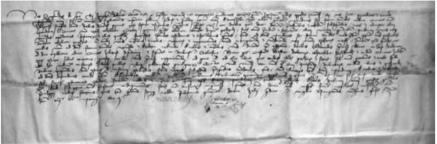
Listina kráľa Žigmunda z roku 1393. Zmienka o mýte v Pliešovciach (ŠA Zvolen)

ďalšie svedectvo, podľa ktorého sa ešte pamätal, že na mieste, kde sa nachádza dedina Abstos, nebol vtedy žiadny dom [18]. Prameň uvádza dvojazyčné názvy sídiel. Nemci z okolia Pliešoviec označovali Sásu názvom Schonau („Pekná Niva“), Lehôtku názvom Abstos („Poruba“)