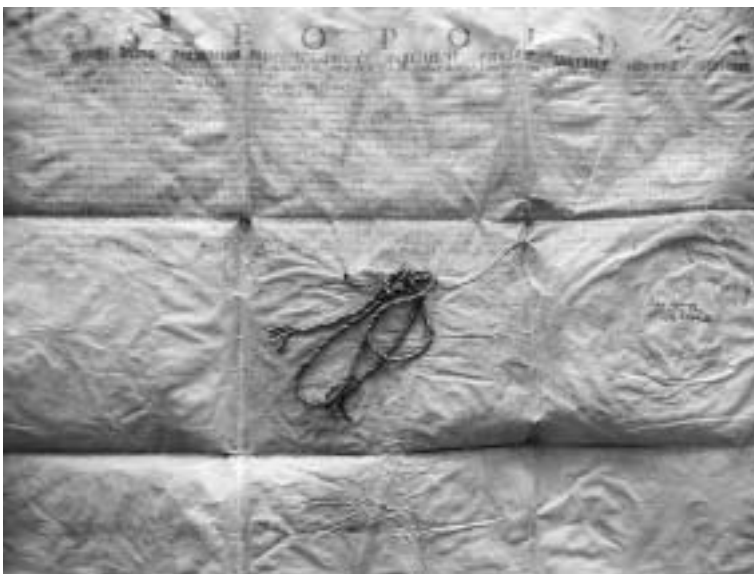
Potvrdenie privilégií kráľom Leopoldom v roku 1688