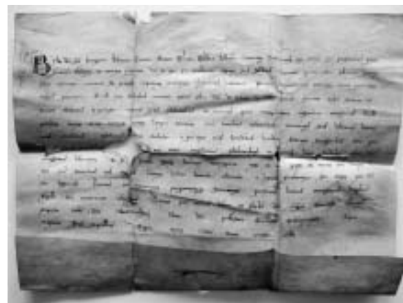
▲ Listina kráľa Bela IV. z roku 1256. Prvý písomný doklad o obci Pliešovce (ŠA Zvolen)