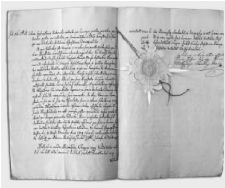
Kontrakt Pliešoviec z roku 1774 (ŠÚBA B. Štiavnica)

Zmeny vo vlastníckych pomeroch ovplyvnili v prvej tretine 19. stor. priaznivý hospodársky vývoj. V roku 1805 hradné majetky Esterházyovcov prešli do správy komorského panstva [85]. Pliešovce sa zaradili pod kráľovskú správu a nevyčerpávali sa už v sporoch so zemepánmi. Významným zdrojom príjmov mestskej pokladne sa stali tzv. regálske benefíciá. Zarádovali sa sem majetky, ktoré mestečko dávalo do árendy (prenájmu) za dohodnutú sumu podnikavým obyvateľom. Napr. v účtovnom období 1817–1818 poberali Pliešovce najväčšie príjmy z prenájmu mestskej krčmy, hostinca, mlynov, páleníc, pivovaru a jatky. Celkové príjmy dosiahli výšku 2604 zlatých a 29 3/4 grajciarov. Bežné výdavky tvorili naproti tomu 1579 zlatých a 39 grajciarov. Výraznejšiu investíciu tvorili náklady na budovanie mestskeho domu, na ktorý mestečko vynaložilo 9356 zlatých a 27 grajciarov [86]. Vyššie príjmy plynuli z predaja vína, pálenky, ale najmä piva. Starý pivovar sa nachádzal priamo v mestečku. V roku 1823 postavili Pliešovce nový pivovar pri Zábave [87]. Na kvalitu a predaj piva dohliadal šafár [88]. Víno sa nakupovalo prevažne v novohradských obciach [89]. Krčmu a hostinec navštevovali okrem počestných aj miestni obyvatelia. Pitie bolo častou príčinou úpadku