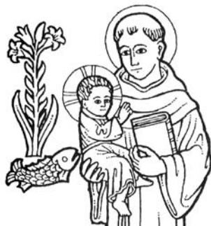
Obr. 12. Jedna z ikonografických podob sv. Antonína z Padovy (upraveno podle Heyduk 2001, 89).