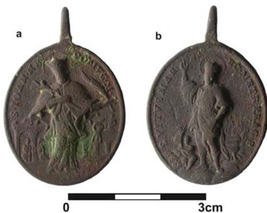
Obr. 3. Medailon s motivem sv. Jana Nepomuckého na aversu (a) a sv. Václava na reversu (b). Břeclav, hr. č. 89; konec 17. – počátek 18. století (foto M. Králík; upravila autorka).