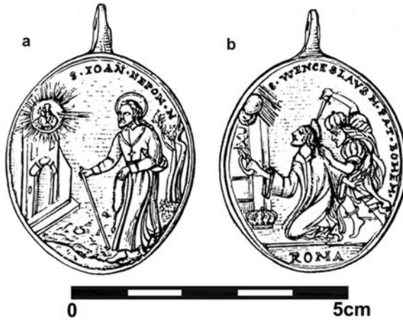
Obr. 5. Medailon s motivem sv. Jana Nepomuckého na aversu (a) a sv. Václava na reversu (b). Brno, hr. č. 334; 1729 (?) (kresba D. Švalbachová; upravila autorka).