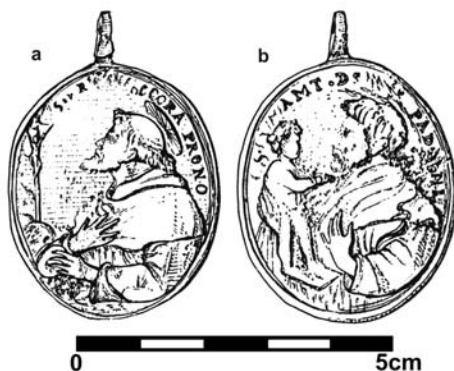
Obr. 9. Medailon s motivem sv. Augustina na aversu (a) a sv. Antonína z Padovy na reversu (b). Brno, hr. č. 338; 18. století (kresba D. Švalbachová; upravila autorka).