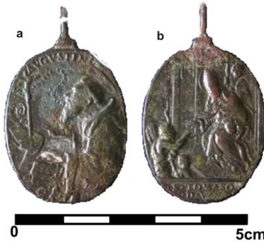
Obr. 8. Medailon s motivem sv. Augustina na aversu (a) a sv. Tomaše z Villanovy na reversu (b). Břeclav, hr. č. 90; 17. století (?) (foto M. Králík; upravila autorka).