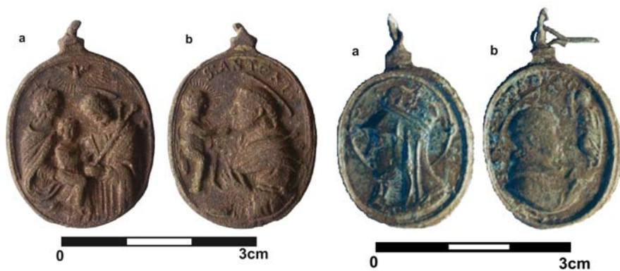
Obr. 10. Medailon s motivem sv. Rodiny na aversu (a) a sv. Antonína z Padovy na reversu (b). Soukromá sbírka, Tišnovsko; 17. – 18. století (foto M. Králík; upravila autorka).