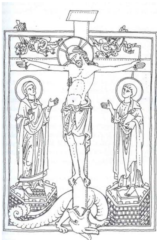
Obr. 4. Ukrižovaný Kristus poráža draka, 1. polovica 13. storočia, Nemecko (KOUTSKÝ, K.: Draci stredovekého sveta . Praha: Mladá fronta 2005, s. 97)