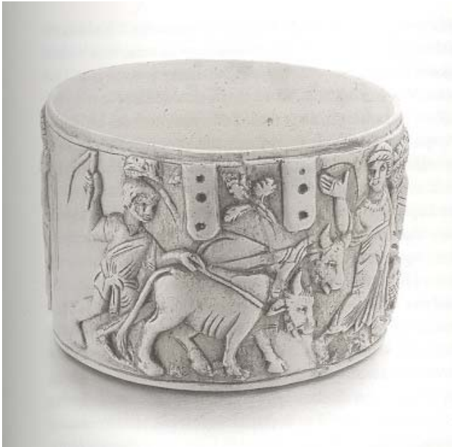
Obr. 3. Rímska pyxida z Čiernych Kľačian zobrazujúca zakladanie Ríma oráčom (DVOŘÁK, P.: Stopy dávnej minulosti 3, Zrod národa. Budmerice : Rak, 2004, s. 143)