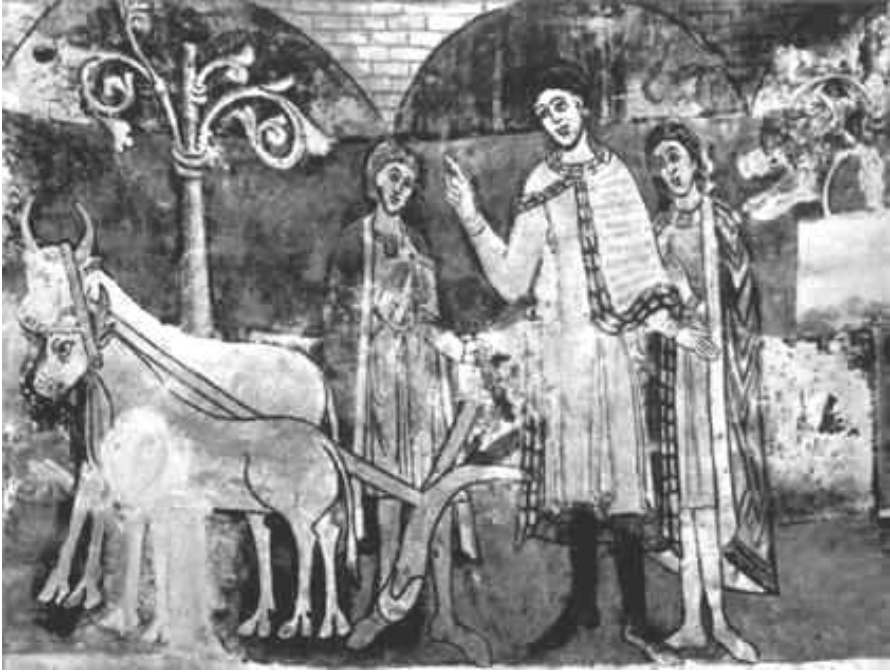
Obr. 2. Přemysl Oráč, praotec českých Přemyslovcov, freska z rotundy svätej Kataríny v Znojme, začiatok 12. storočia ( http://www.znojemskarotunda.com/ikonsamo.htm )