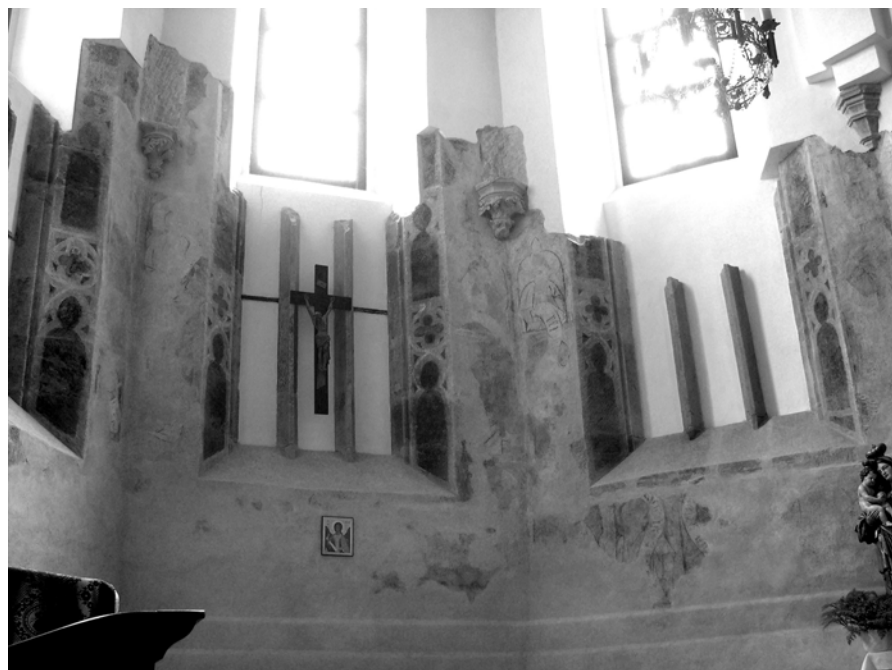
Obr. 8. Pohľad od záveru dnešnej kaplnky sv. Michala.