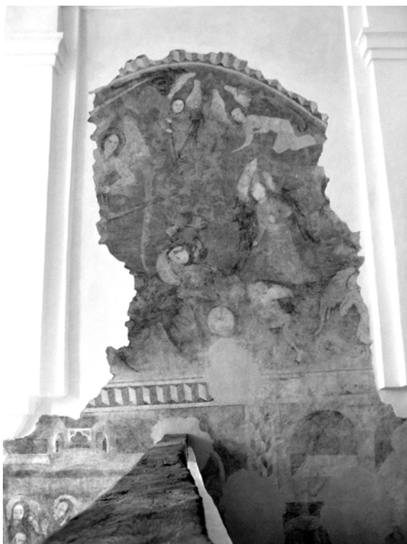
Obr. 5. Váženie duší, výjav na južnej stene.