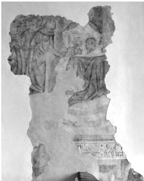
Obr. 6. Vera Efigies, výjav na severnej stene.