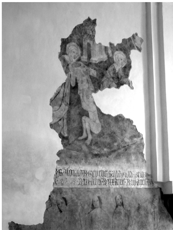
Obr. 7. Výjav so sv. Alžbetou Durínskou.