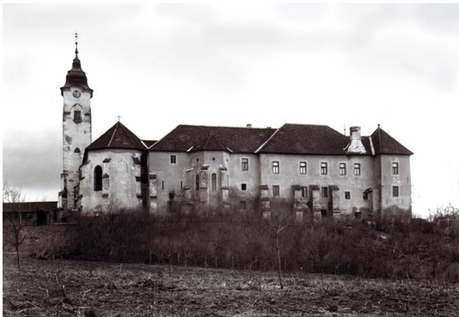
Obr. 1. Pohľad na východnú stranu kláštora so záverom kláštorného Kostola Sv. križa a dnešnej kaplnky sv. Michala.