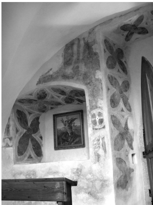
Obr. 9. Nika v západnej stene v podemporovom priestore s pôvodnou stredovekou výmaľbou iluzívnou kružbou.