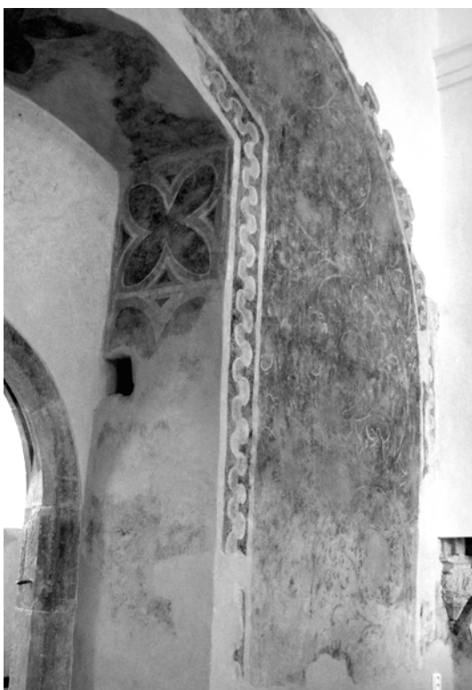
Obr. 10. Plocha západnej steny nad emporou s ornamentálnou rozvilinovou výzdobou.