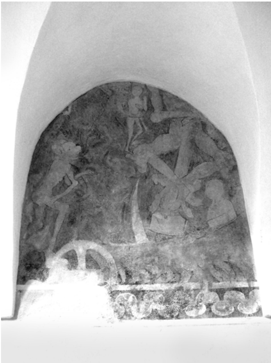
Obr. 4. Výjav zo scény Peklo na južnej stene v podemporovom priestore.